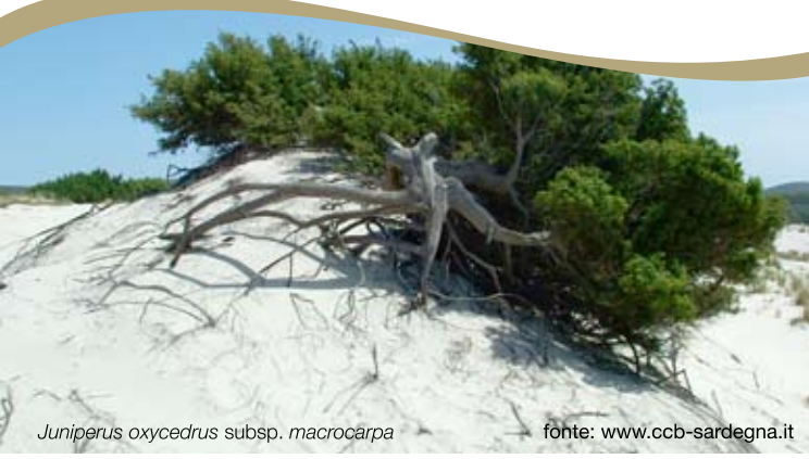
Juniperus oxycedrus subsp. macrocarpa

I sedimenti provenienti dalla spiaggia o da corsi d'acqua limitrofi possono essere trasportati dal vento e accumulati nel retro spiaggia, formando depositi, chiamati campi dunali, le cui dimensioni possono variare da pochi metri a diversi chilometri quadrati, raggiungendo in alcuni casi altezze di oltre dieci metri. Questi ecosistemi, poveri di nutrienti e sferzati da venti salmastri, vengono comunque popolati da specie vegetali (alcune delle quali rare o a rischio di estinzione) che tendono a disporsi in fasce parallele alla riva. Dopo una prima fascia in cui la vegetazione è assente, incontriamo le specie pioniere annuali, come la Cakile maritima . Via via che ci si allontana dalla riva, compaiono altri tipi di vegetazione erbacea perenne, che contribuiscono a stabilizzare la duna. Sulle dune maggiormente consolidate si instaura una vegetazione costituita da boscaglie in cui predomina il ginepro coccolone ( Juniperus oxycedrus subsp. macrocarpa ) Dal momento in cui la duna si forma (spesso a partire dai resti spiaggiati di Posidonia oceanica e altro materiale organico) e per tutta la sua esistenza, le piante marine e terrestri svolgono un ruolo fondamentale per la sua conservazione.